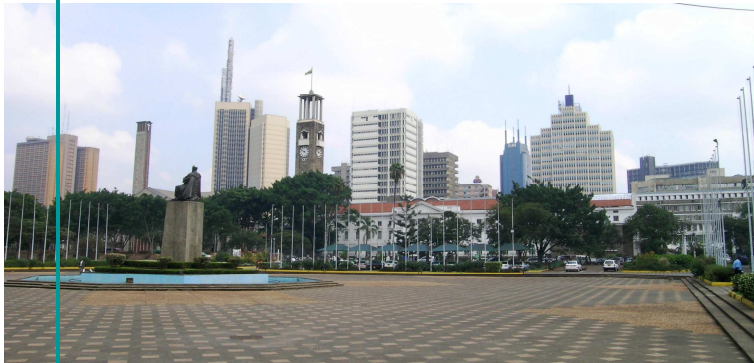
Business horizon / Orizontul afacerilor – Nairobi, Kenya

Notă practică: Textul albastru are hyperlink