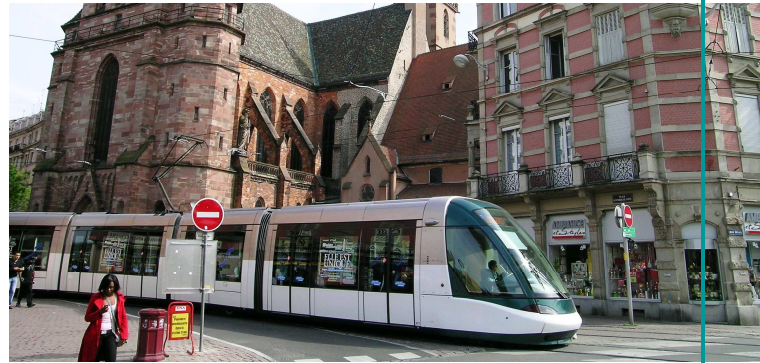
City scape / Peisaj urban – Strasbourg, France