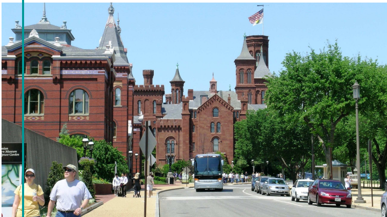
Smithsonian Institute / Institutul Smithsonian, Washington DC