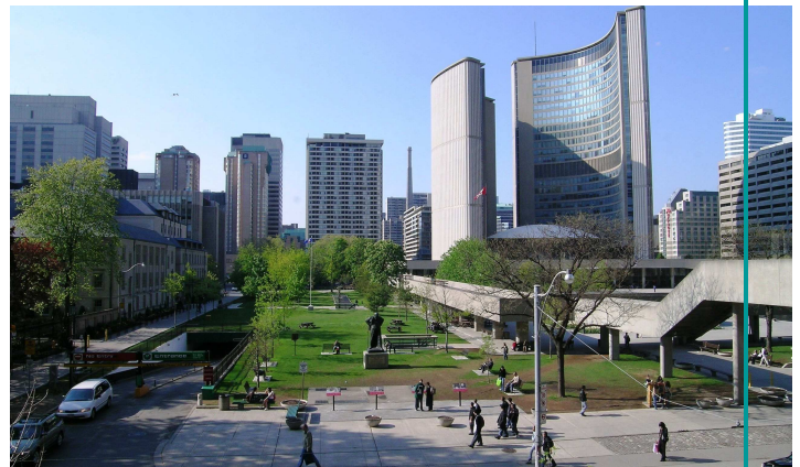
City Hall and Business Quarter / Primăria și Cartierul Afacerilor, Toronto