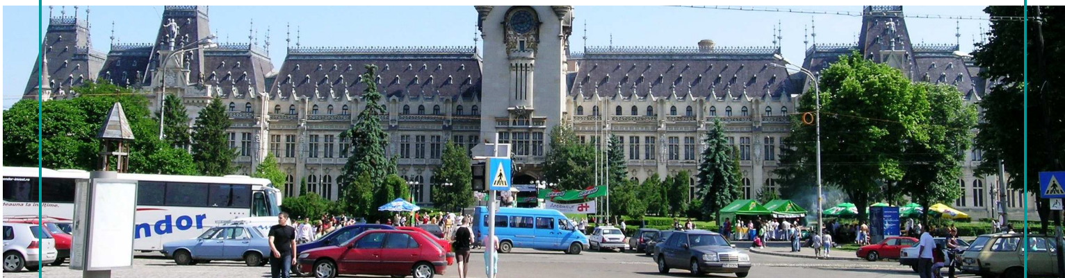
Vremuri noi în Iași, Romania