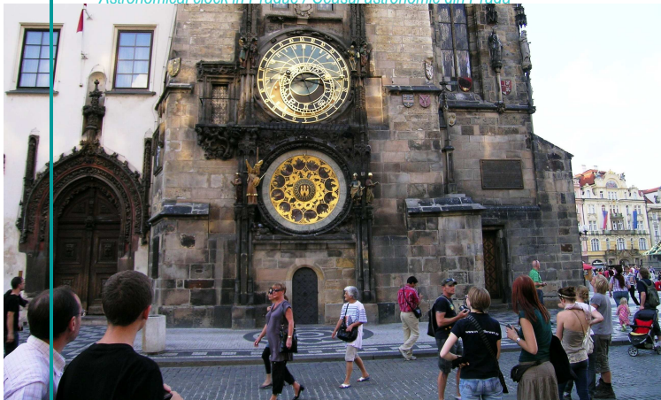
Astronomical clock in Prague / Ceasul astronomic din Praga