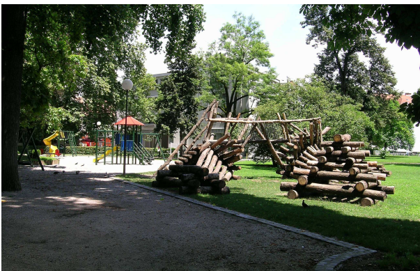
Ljubljana – Argentina park / parcul Argentinei

Dinkova Dirimanova, V. The role of informal institutions for sustainable use of fragmented land in Bulgaria. (PS1A6).