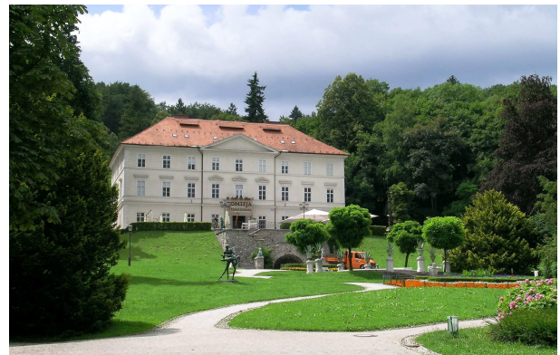
Ljubljana – Tivoli park / parcul Tivoli ("Land of Birds" / "Țara Păsărilor")

Milichar, J., "Valuarea economică a modificării valorii pădurilor în munții Jizerske Hory: un model de comportament contingent". (PS2A8). (Este vorba de munți din Cehia)