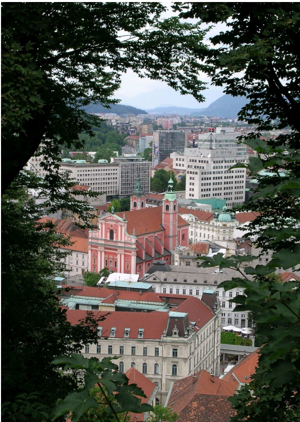
City of Ljubljana

Well, yes! For ecological economists, the today's revisiting of the fundamentals of global development – occasioned by the crisis – are obviously a unique window of opportunity, a largely unexpected one. This window is fast developing and perhaps already closing up.