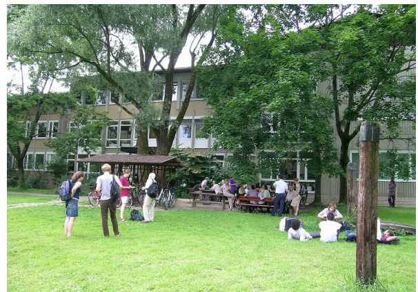
University of Ljubljana, life sciences / științele vieții - campus