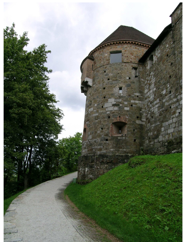
Ljubljana Castle, to the main entrance

Nu este o imagine banală – oarecum neașteptată dar totuși surprinzător de familiară sufletului profesionistului științei prins între detaliile bine rodiate ale roțițelor academice și dramatismul 'satului Planetar' aflat în criză, în derivă într-o istorie incertă. Și imaginea asta nu a mai vrut să părăsească forumul interior: Este un simbol, pentru călătorul științei un semn al relației contemporane dintre comunitatea academică ("aici sus"?) și cea globală ("acolo jos").