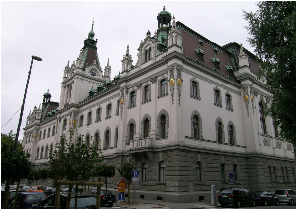
University of Ljubljana, main building / clădirea rectoratului

The meeting gathered about 200 delegates from all Europe, but also from Africa, North and South America, Africa, Australia and Asia.